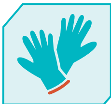
מסירים כפפות מיד בגמר הטיפול