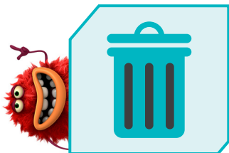
שומרים על סביבה נקיה