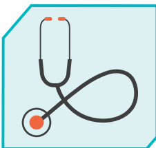
מחטאים ציוד אישי בין מטופלים