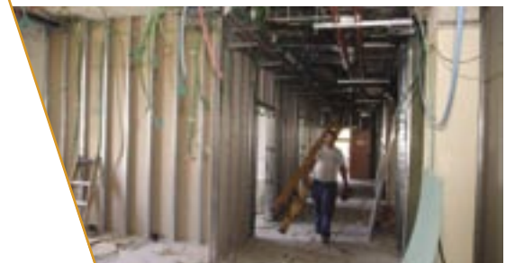
החלו השיפוצים במחלקת הילדים בהר הצופים