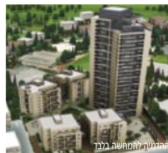
הדמיה להמחשה בלבד

גני ציון; רח' אלעזר הגדול, קטמון, ירושלים www.ganei-zion.co.il