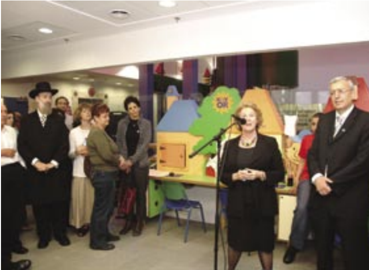
טקס חנוכת המחלקה

המחלקה כוללת יחידה להשתלות מח עצם ומערך לטיפול יום • בין המטפלים: פסיכולוגים, מרפאים באמנות וליצינים רפואיים