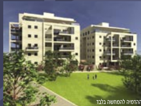
הדמיה להמחשה בלבד